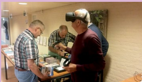
Foto 2. Het bekijken van een 3D-video met een VR-bril.