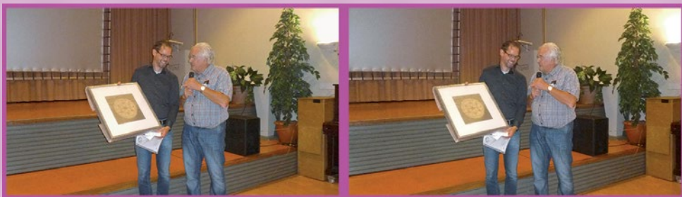
Foto 3. John Klooster met zijn 1 e prijs van de fotocompetitie van het ISU-congres 2019.