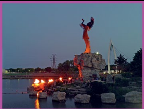
“The Keeper of the Plains”, beeld van Native American kunstenaar Blackbear Bosin.