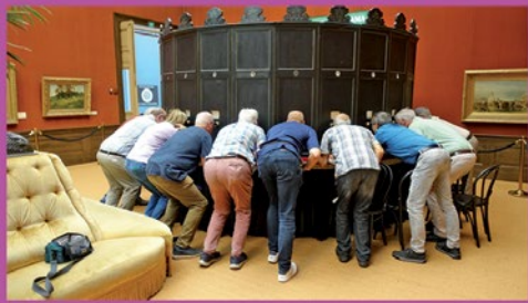
Foto 2. Lunchpauze tijdens de verenigingsdag op 25 mei 2024.

Foto 1. Groepsfoto bij het Kaiserpanorama in het Teylers Museum.