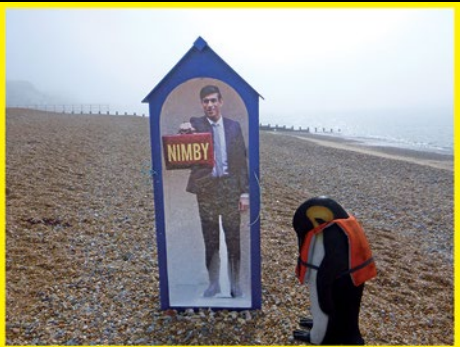
"Not in my backyard", op het strand bij de pier in Hastings, Engeland.