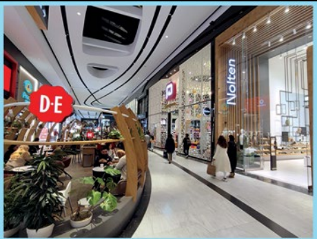
Overdekt winkelcentrum Westfield Mall of the Netherlands in Leidschendam.